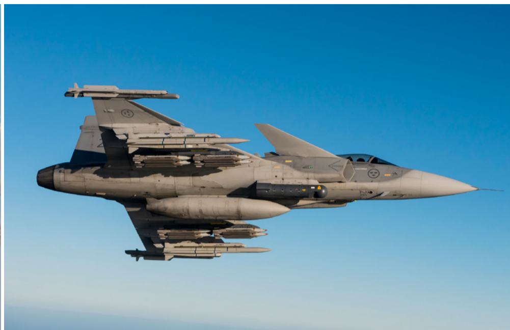
Slika 3: JAS-39C Gripen s dvije IRIS-T IC navođena projektila kratkog dometa na vrhu krila, dva MBDA Meteor projektila velikog dometa, 8 GBU-39 planirajućih bombi od 130kg i IAI/Elta TASCAN ciljničkim kontejnerom.

Kad se govori o problemima, kupovina Gripena C/D za Hrvatsku je problematična zbog nekoliko činjenica: