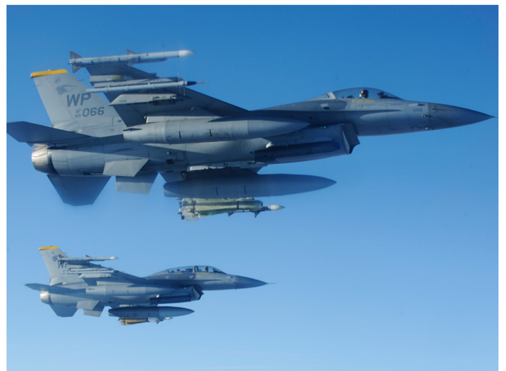
Slika 1: Lockheed Martin F-16

Slika 1: Par F-16 ratnog zrakoplovstva SAD-a, nose po dva AMRAAM projektila zrak-zrak srednjeg dometa, AN/APX-95 TACTS vježbovni kontejner, AN/AAQ-33 Sniper ciljnički kontejner, po dva AGM-65 Maverick projektila zrak-zemlja i po dva odbaciva spremnika goriva kapaciteta 1564l (370 galona). (Foto: Nicky Boogaard. Flickr (CC BY-NC-ND 2.0)).