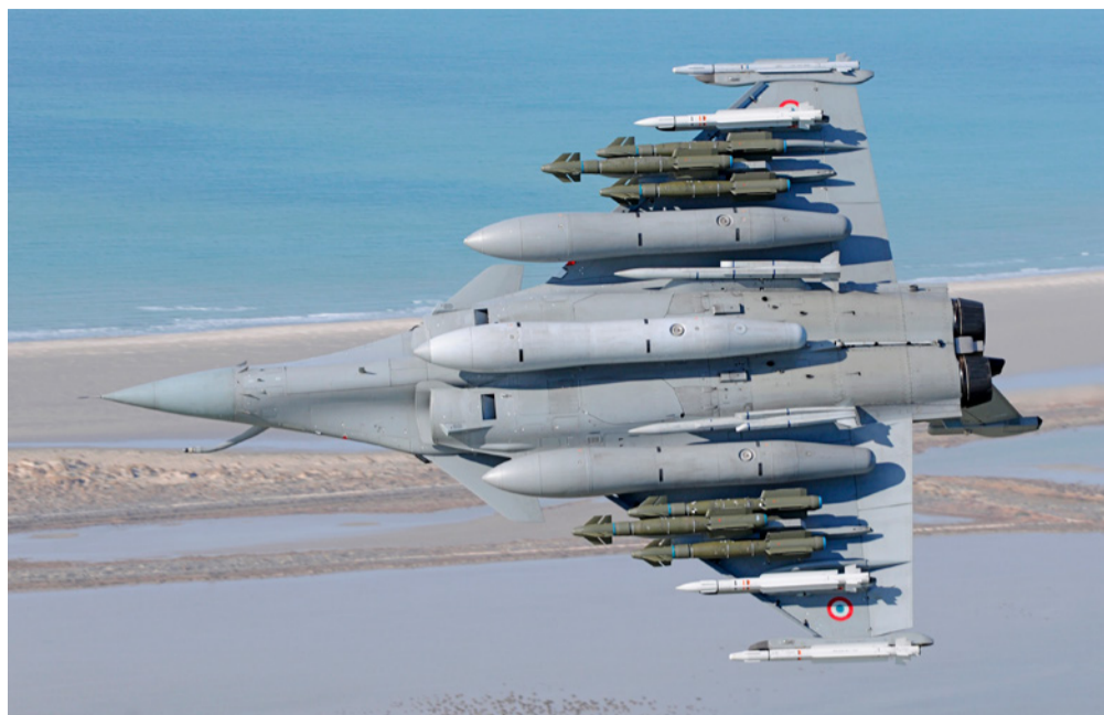
Slika 2: Dassault Rafale s 9,5t goriva i naoružanja. MBDA MICA IC i radarski navođene, šest AASM modularnih preciznih bombi od po 340 kg (sama bomba je 250kg), tri odbaciva spremnika goriva od 2000l i na trupu MBDA Meteor projektili zrak-zrak velikog dometa.