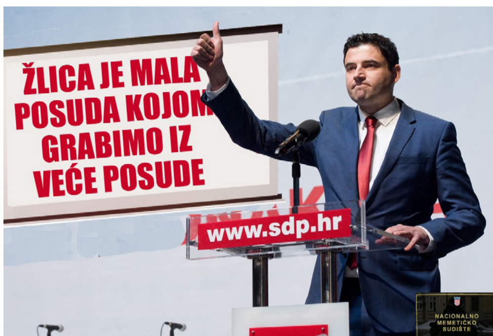
Evo kako razni komentatori na društvenim mrežama doživljavaju Bernardića i njegovu sposobnost vođenja, kako države, tako i samog SDP-a.