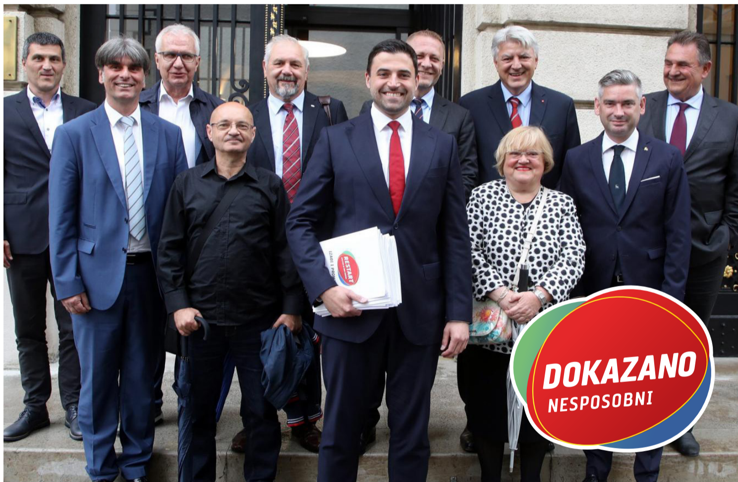
Evo kako društvene mreže komentiraju Restart. Dobili su i novi logo.

Jedna od slabo spominjanih, ali itekako bitnih razdjelnica između političkih tabora, stranaka i osebnih predizbornih koalicija svakako je u filozofiji pristupa državi, njezinim institucijama i sadržaju politike.