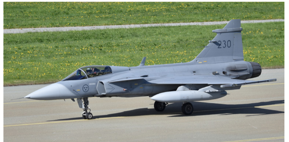
„Saab JAS-39C švedskog ratnog zrakoplovstva.“