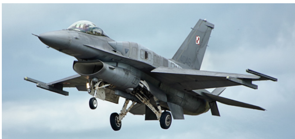
„Lockheed Martin F-16 Block 52 poljskog ratnog zrakoplovstva a konformalnim spremnicima goriva.“

„Ali ekonomija je u kolapsu, koronakriza, recesija i to...“ Nije. Ekonomija nije u kolapsu niti će biti. Hrvatskoj je do početka krize išlo prilično dobro. Da, pandemija koronavirusa je napravila ozbiljne probleme svjetskome gospodarstvu. Ali ono što većina novinara i samopozvanih (ekonomskih) analitičara ne shvaća: jedno su strukturalne recesije poput one iz 2008., koje nastaju kao posljedica neravnoteža na tržištu ili financijskih malverzacija i koje zapravo „vraćaju stvari na svoje“, a drugo je recesija poput ove uzrokovane pandemijom. Ako imate zatvaranje ekonomije od dva-tri mjeseca kao i vrijeme