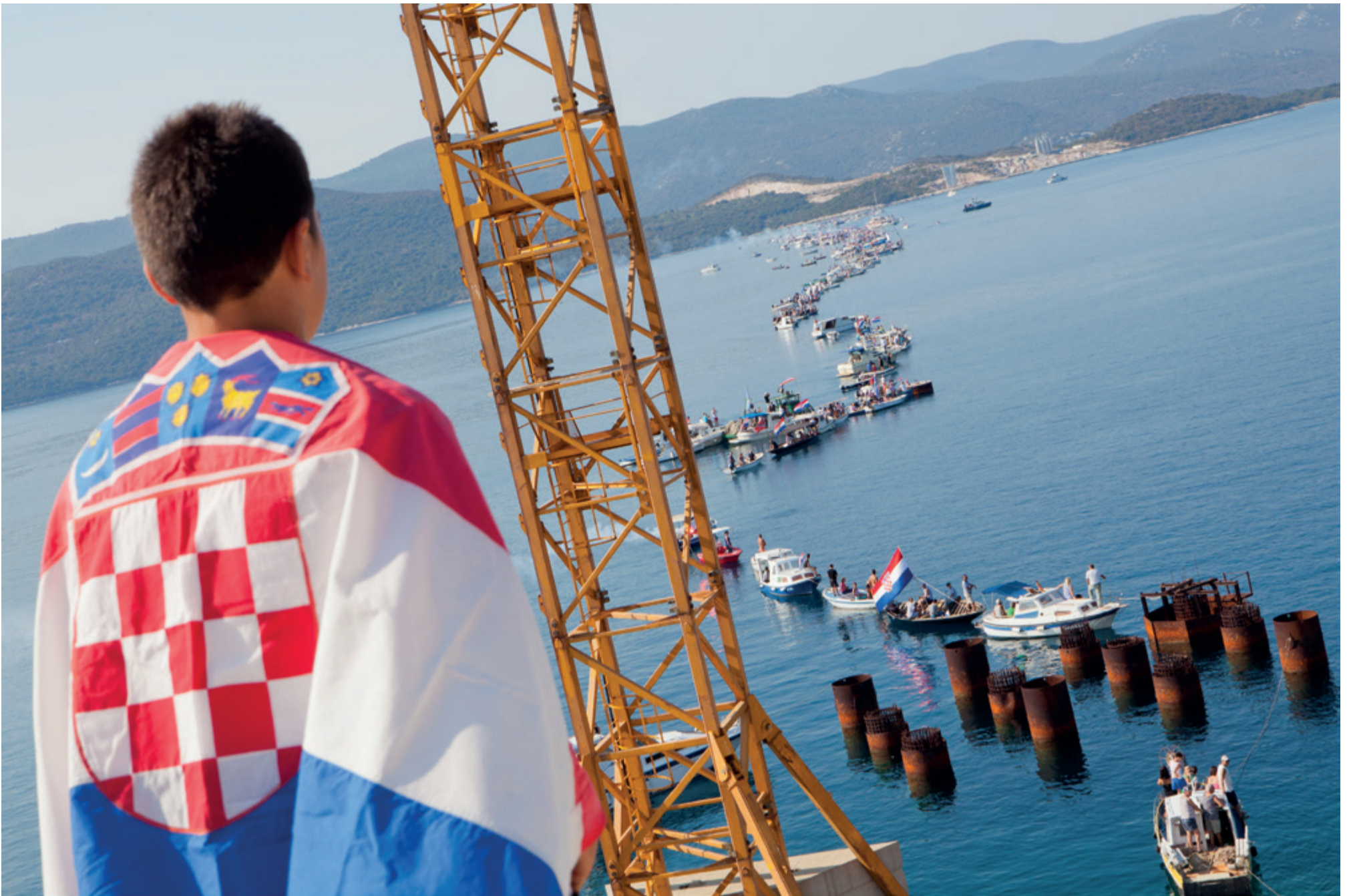
Nekad barkama, a danas mostom spojena Hrvatska! Rezultat rada ustrajnih ljudi svjesnih velebnosti projekta u kojem sudjeluju.