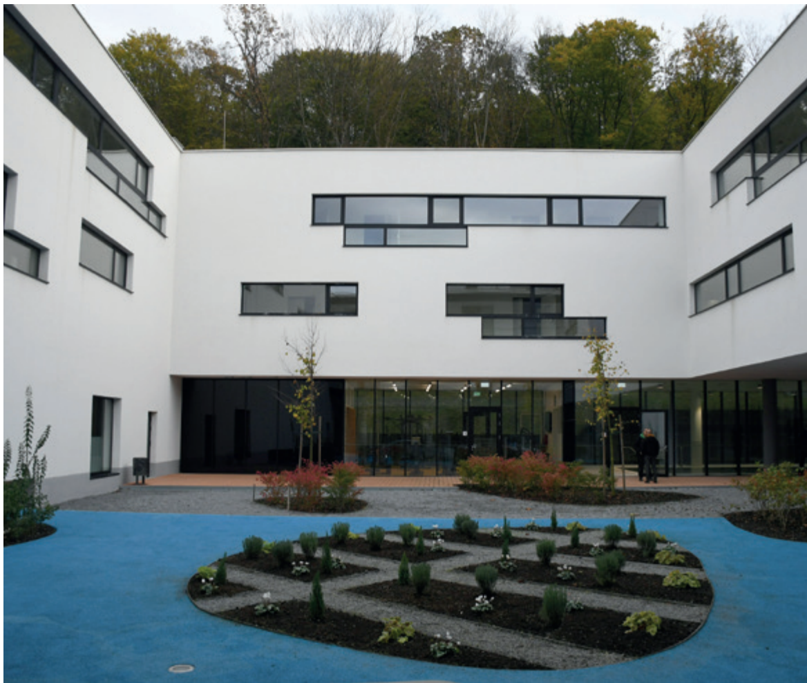
Veteranski centar u Daruvaru.

I Tuđman i Hrvati morali su do samostalne države doći u nametnutom i brutalnom ratu. U tome su, zahvaljujući herojskoj borbi hrvatskih branitelja, na kraju i uspjeli. Međutim, Tuđman je na kraju ipak bio čovjek mira. Najvažniji mirovni pothvat suvremene Europe, tj. mirnu reintegraciju istočne Hrvatske, učinio je kad je ratnog protivnika imao u šaci. Trebalo je biti dovoljno za Nobelovu nagradu.