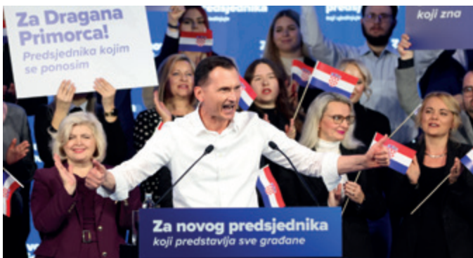
HDZ uz dr. sc. Dragana Primorca!